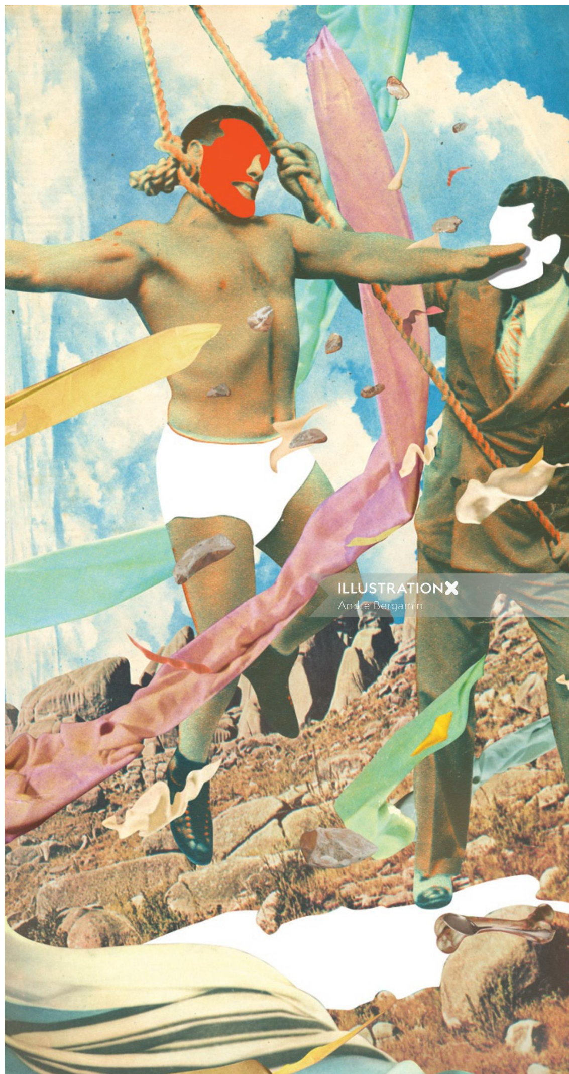
ILLUSTRATION X Andre Bergamin