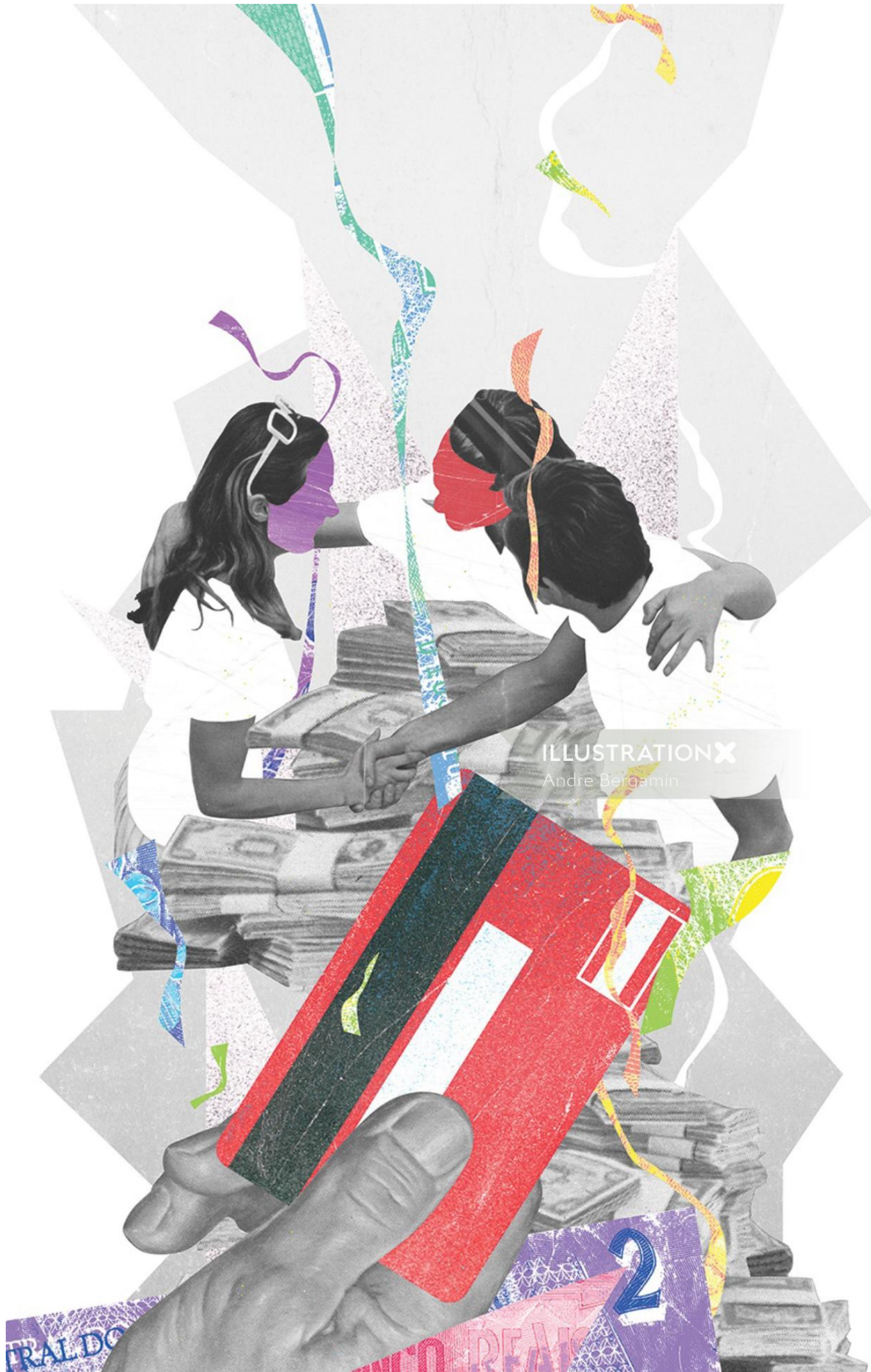
ILLUSTRATION X Andre Bergamin