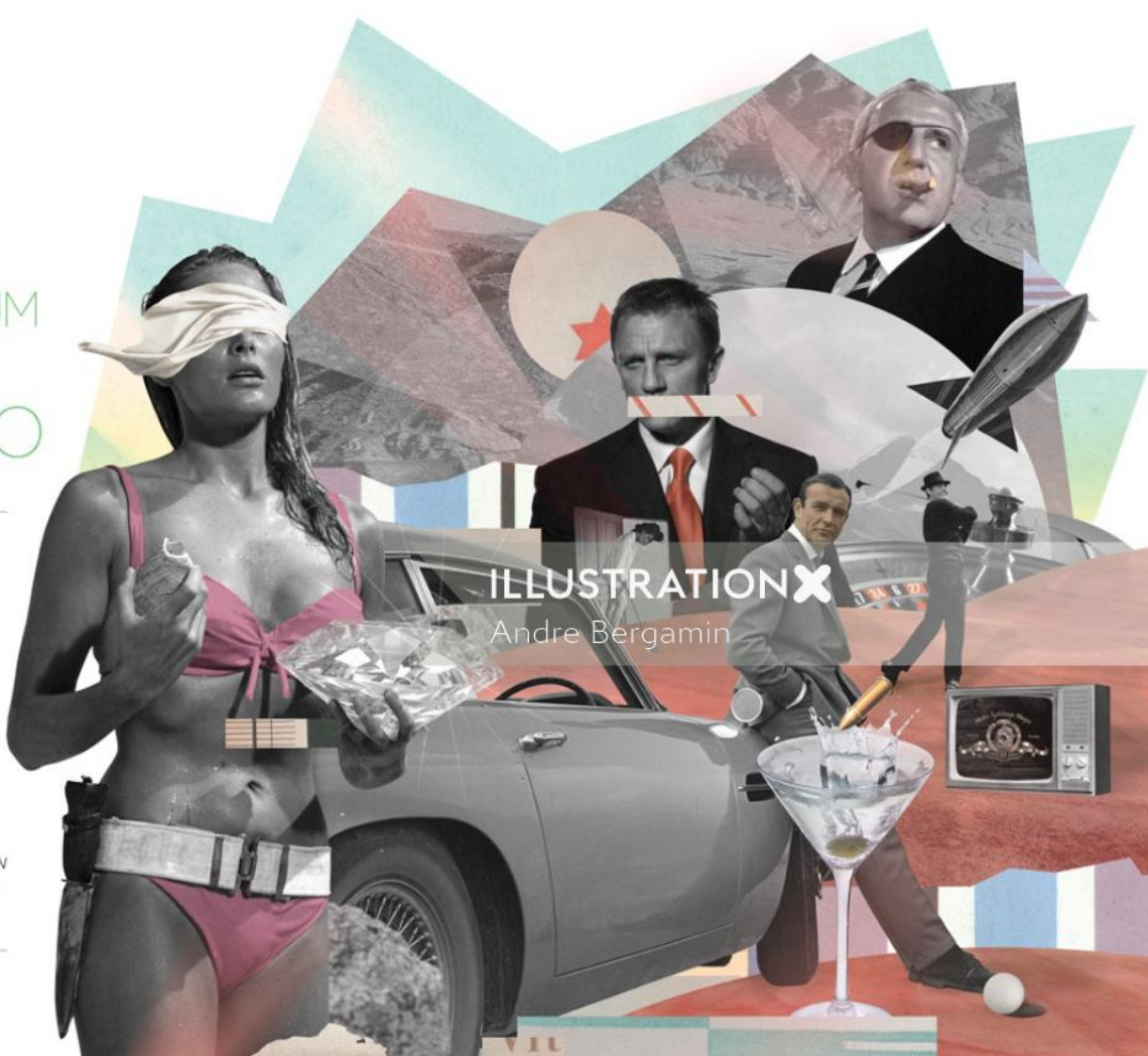
ILLUSTRATION X Andre Bergamin