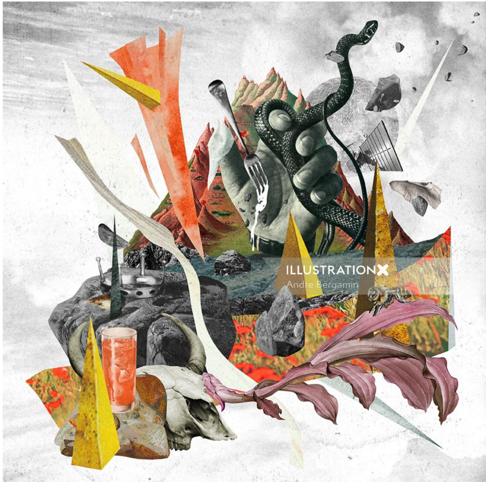
ILLUSTRATION X Andre Bergamin