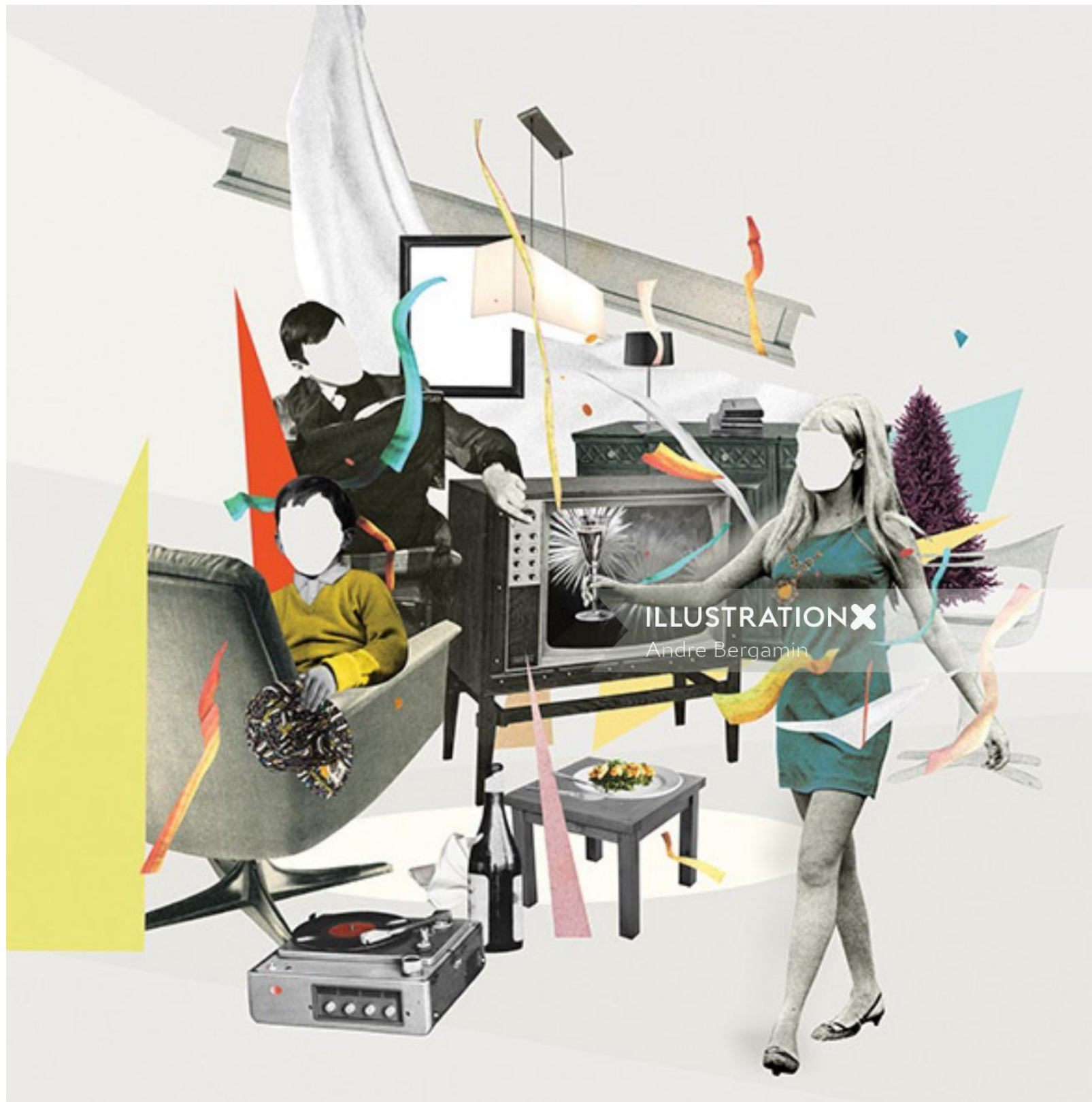
ILLUSTRATION X Andre Bergamin