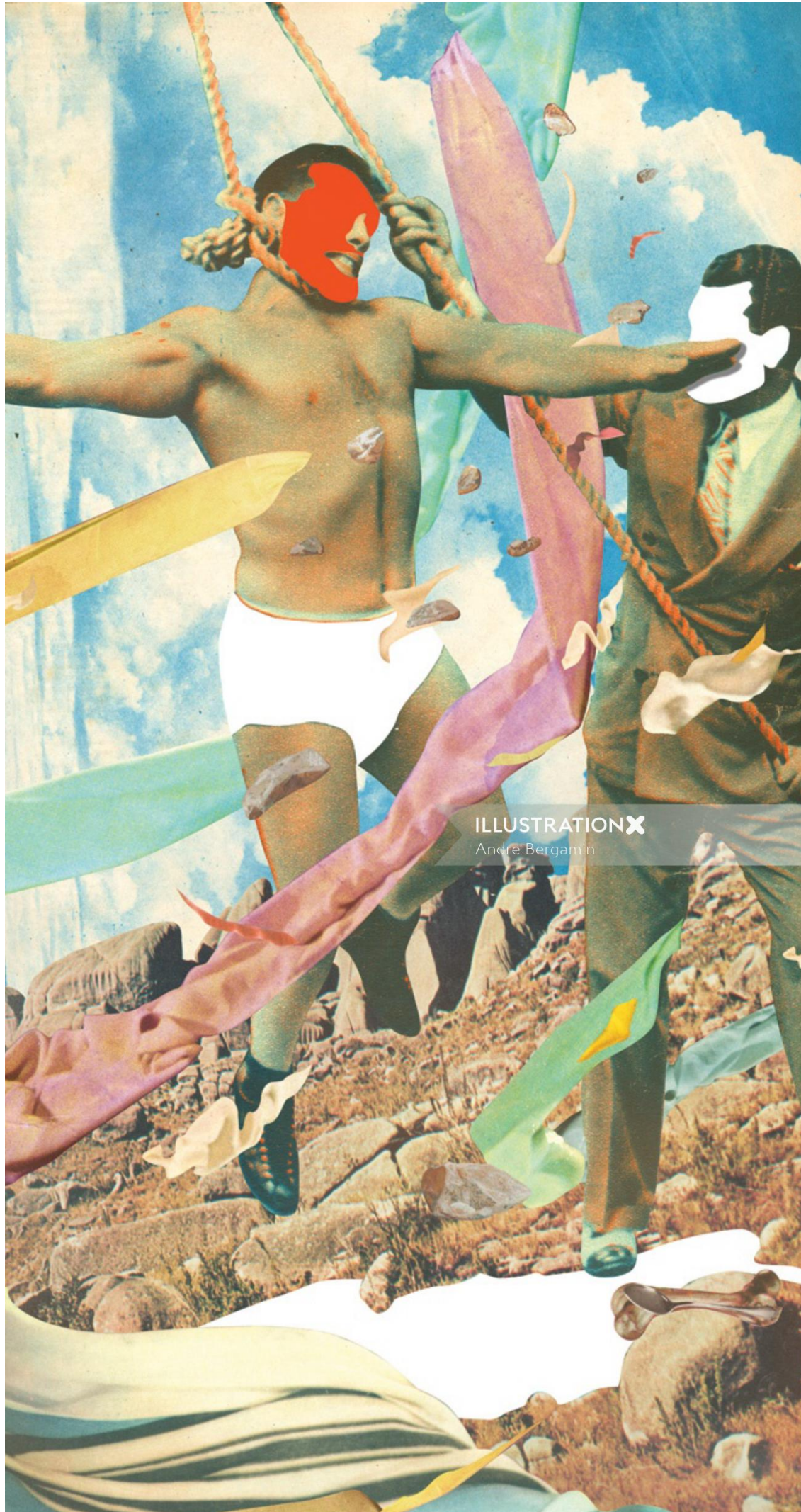
ILLUSTRATION X Andre Bergamin