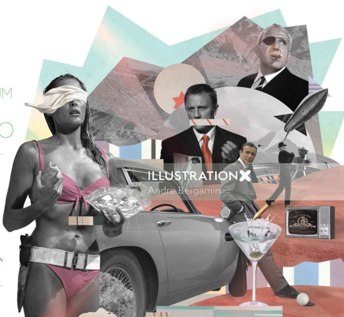
ILLUSTRATION X Andre Bergamin