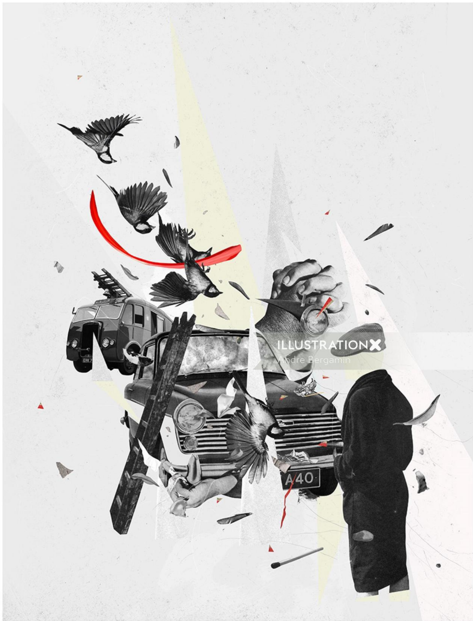
ILLUSTRATION X Andre Bergamin