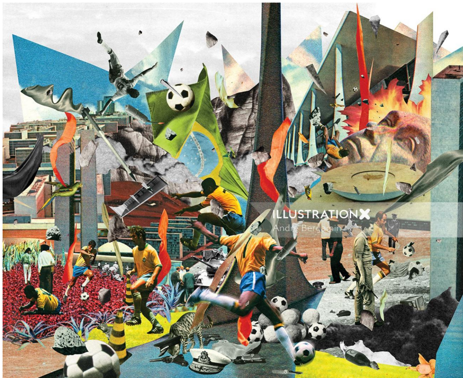
ILLUSTRATION X Andre Bergamin