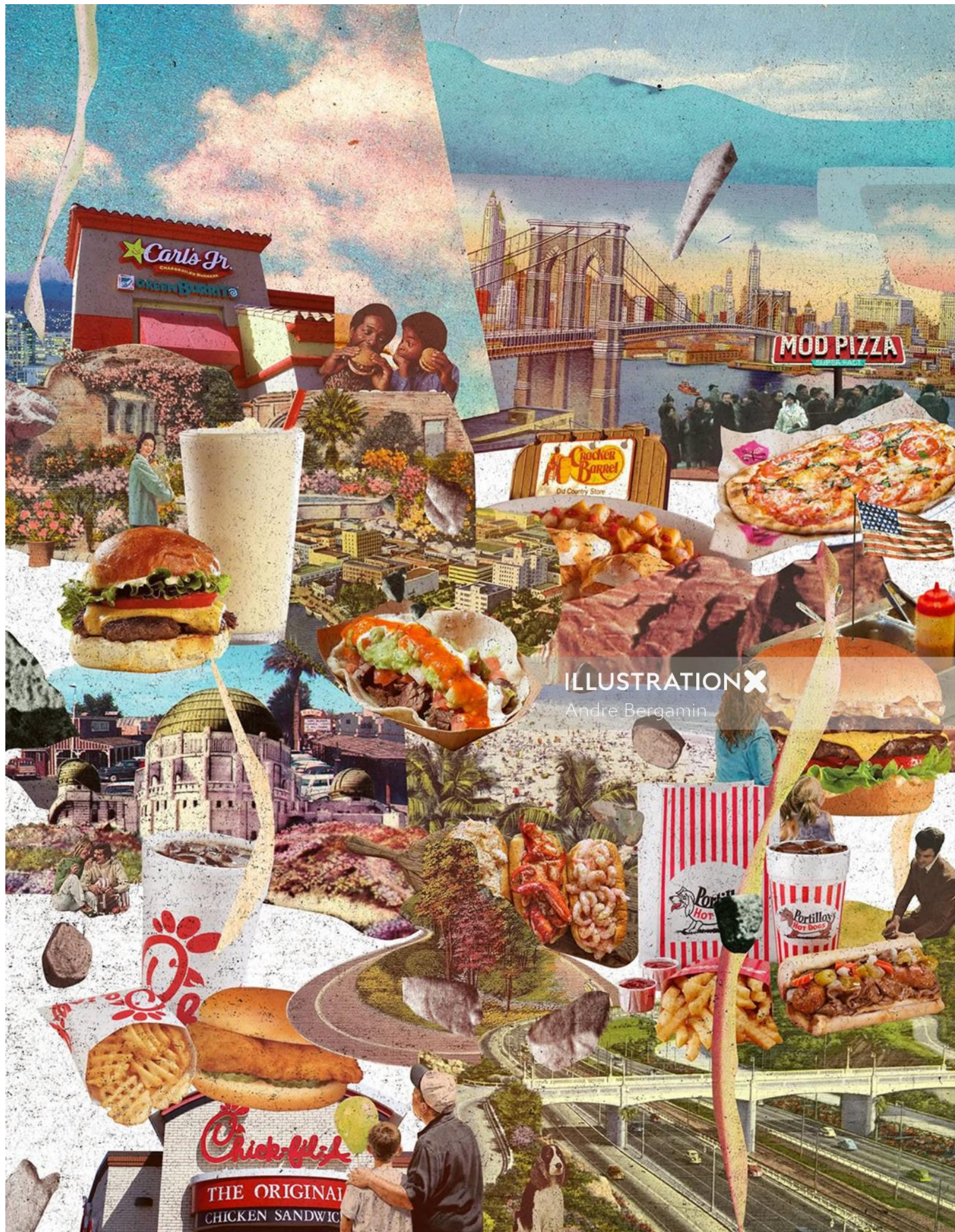
ILLUSTRATION X Andre Bergamin