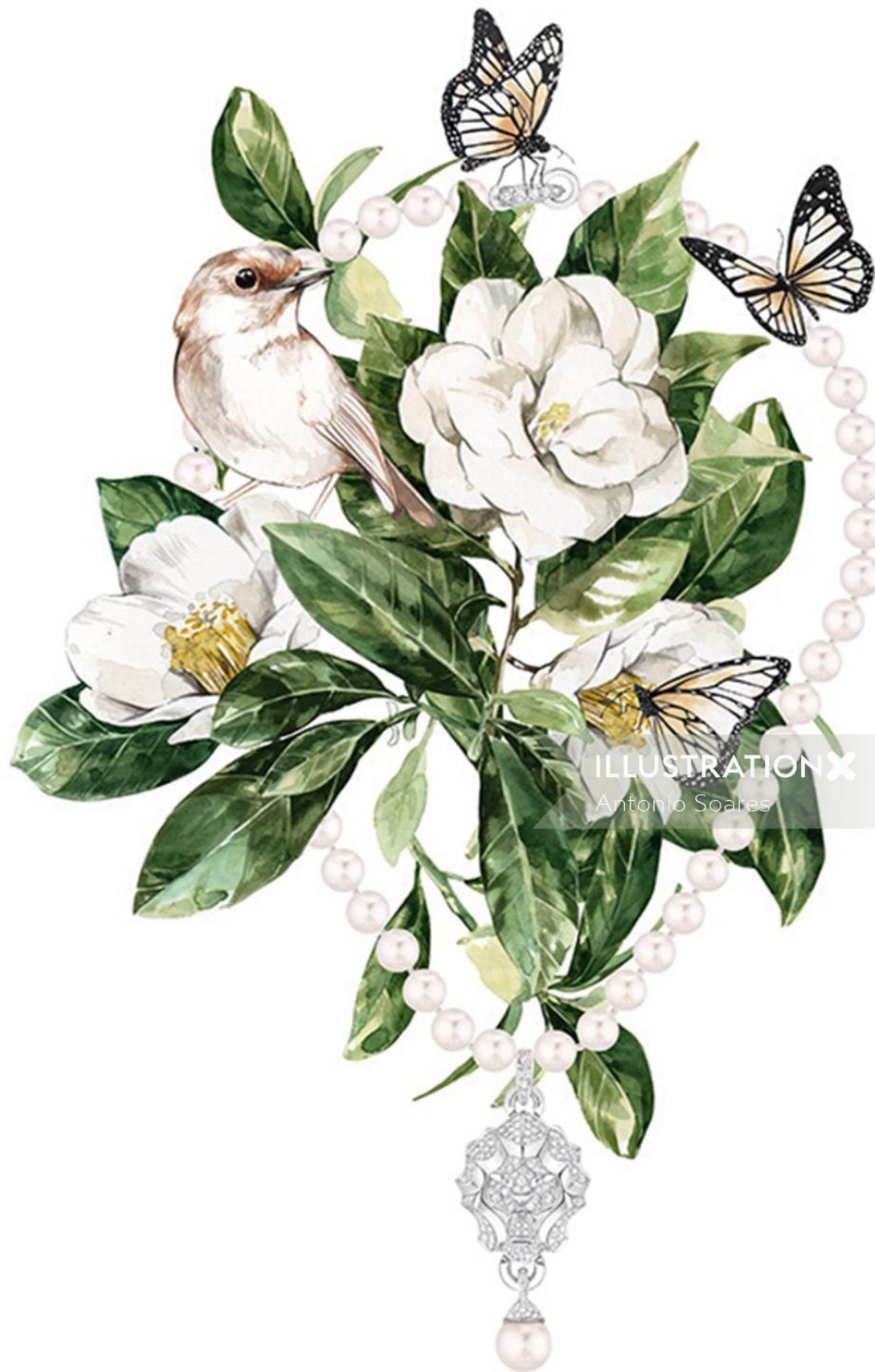
ILLUSTRATION X Antonio Soares