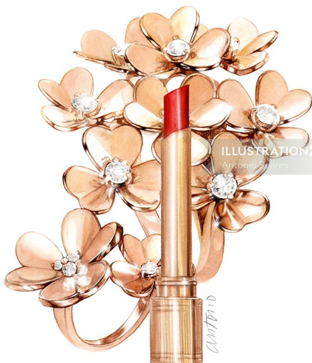
ILLUSTRATION X Antonio Soares