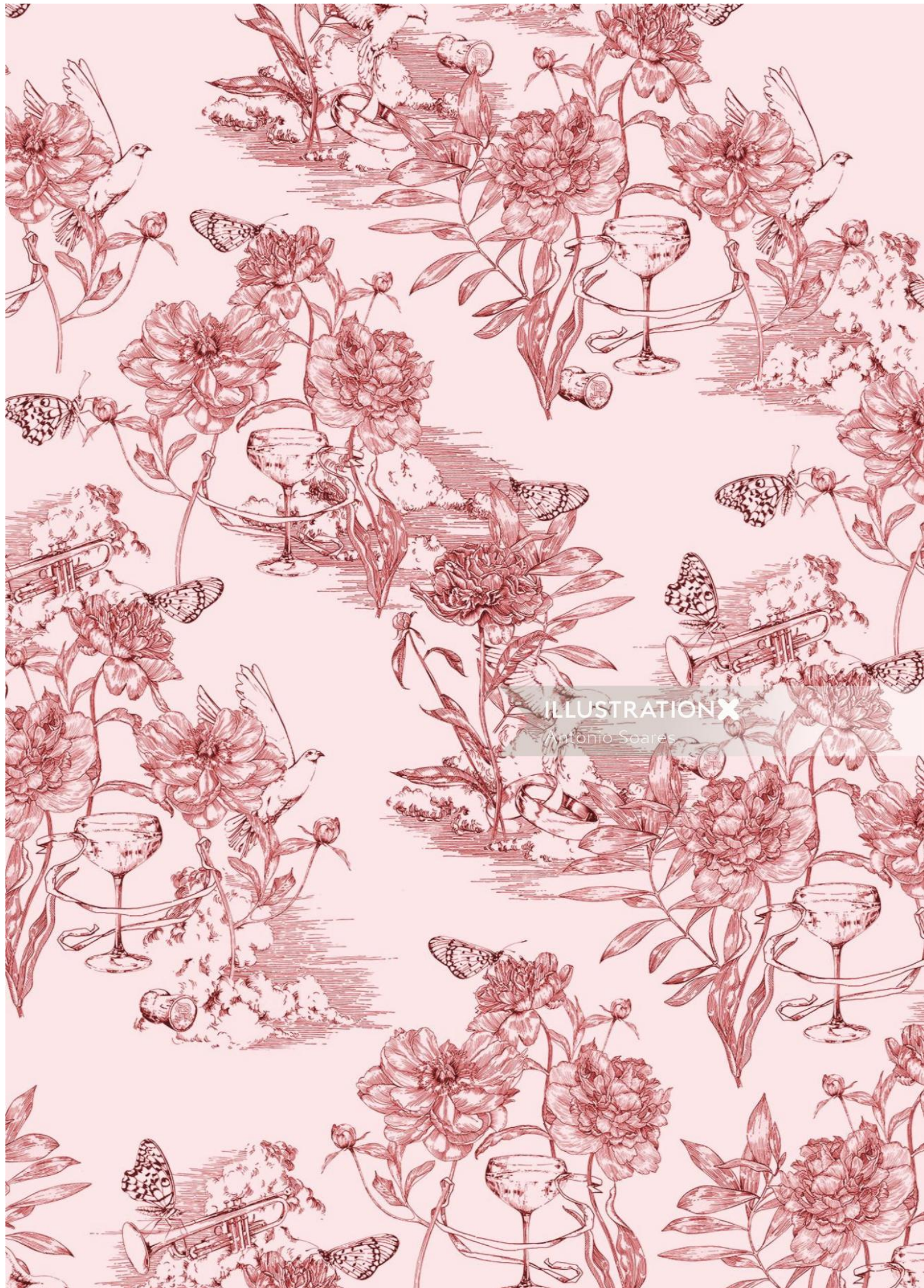
ILLUSTRATION X Antonio Soares