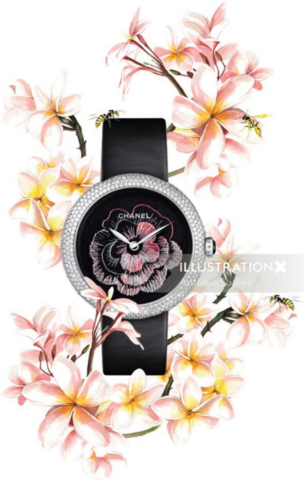
Chanel, price upon request. OPPOSITE Ulysse Nardin ($37,600).