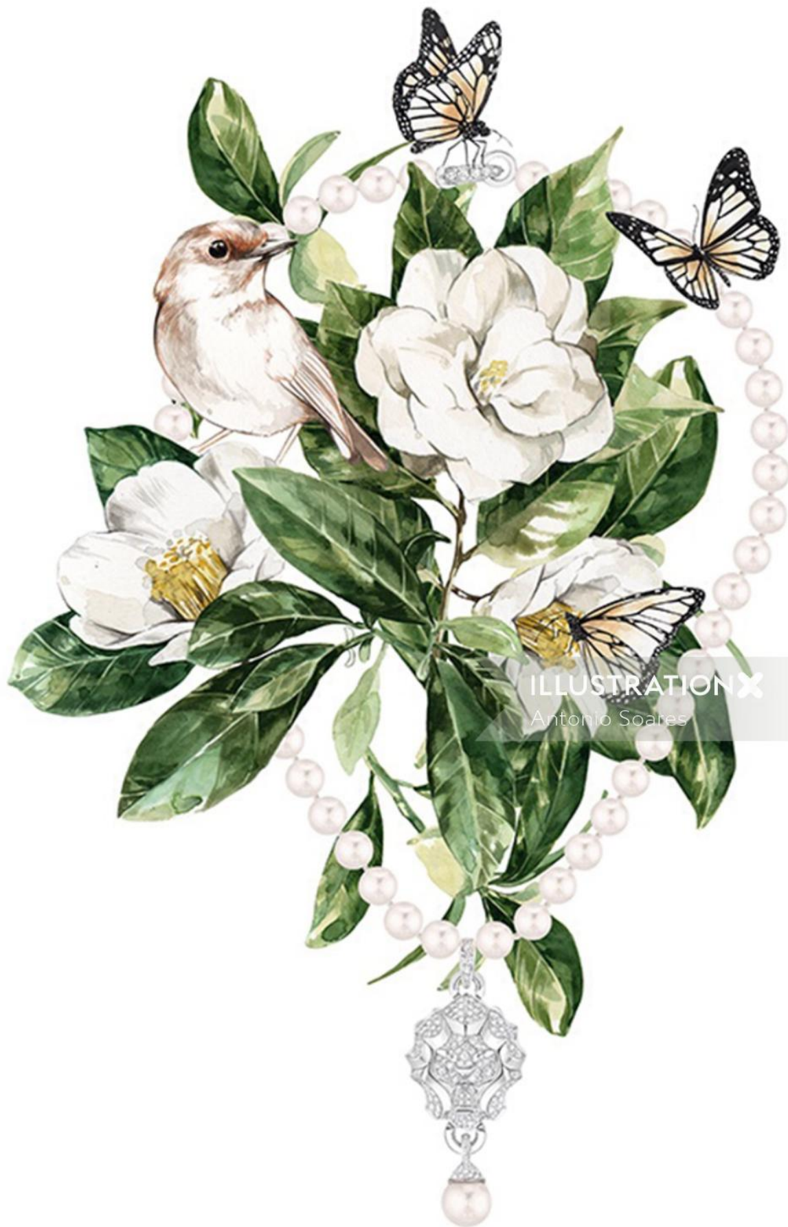
ILLUSTRATION X Antonio Soares