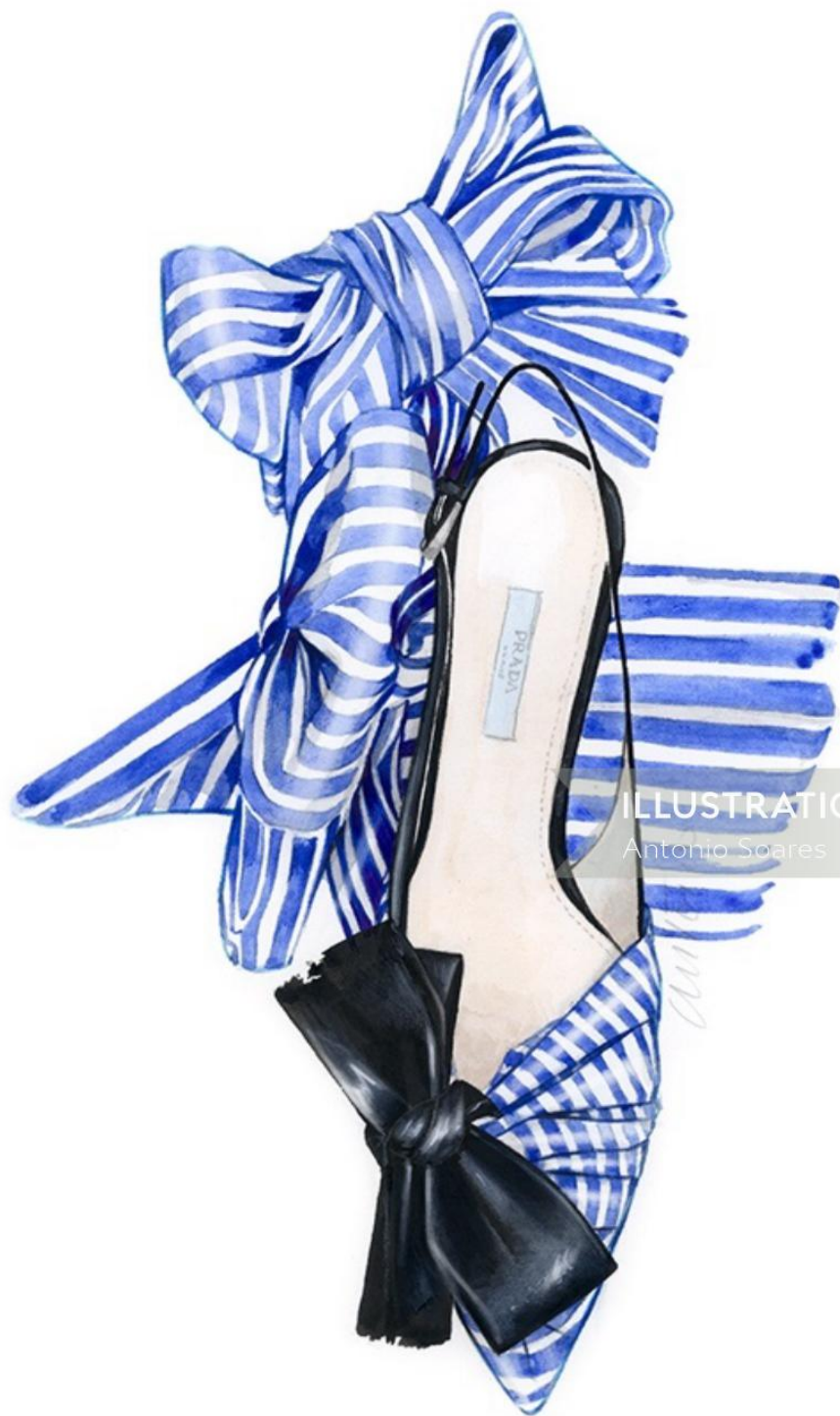
ILLUSTRATION X Antonio Soares