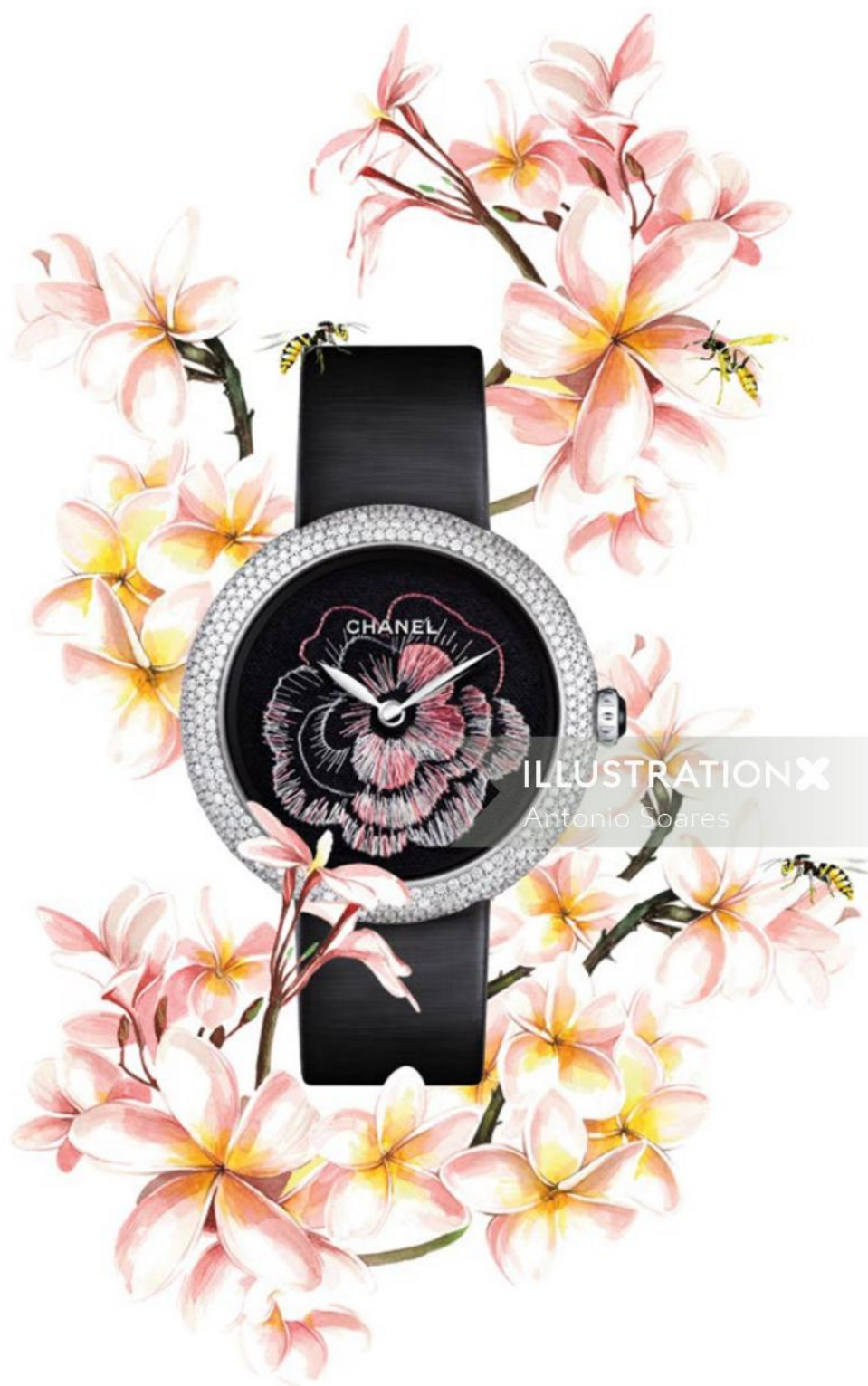
ILLUSTRATION X Antonio Soares