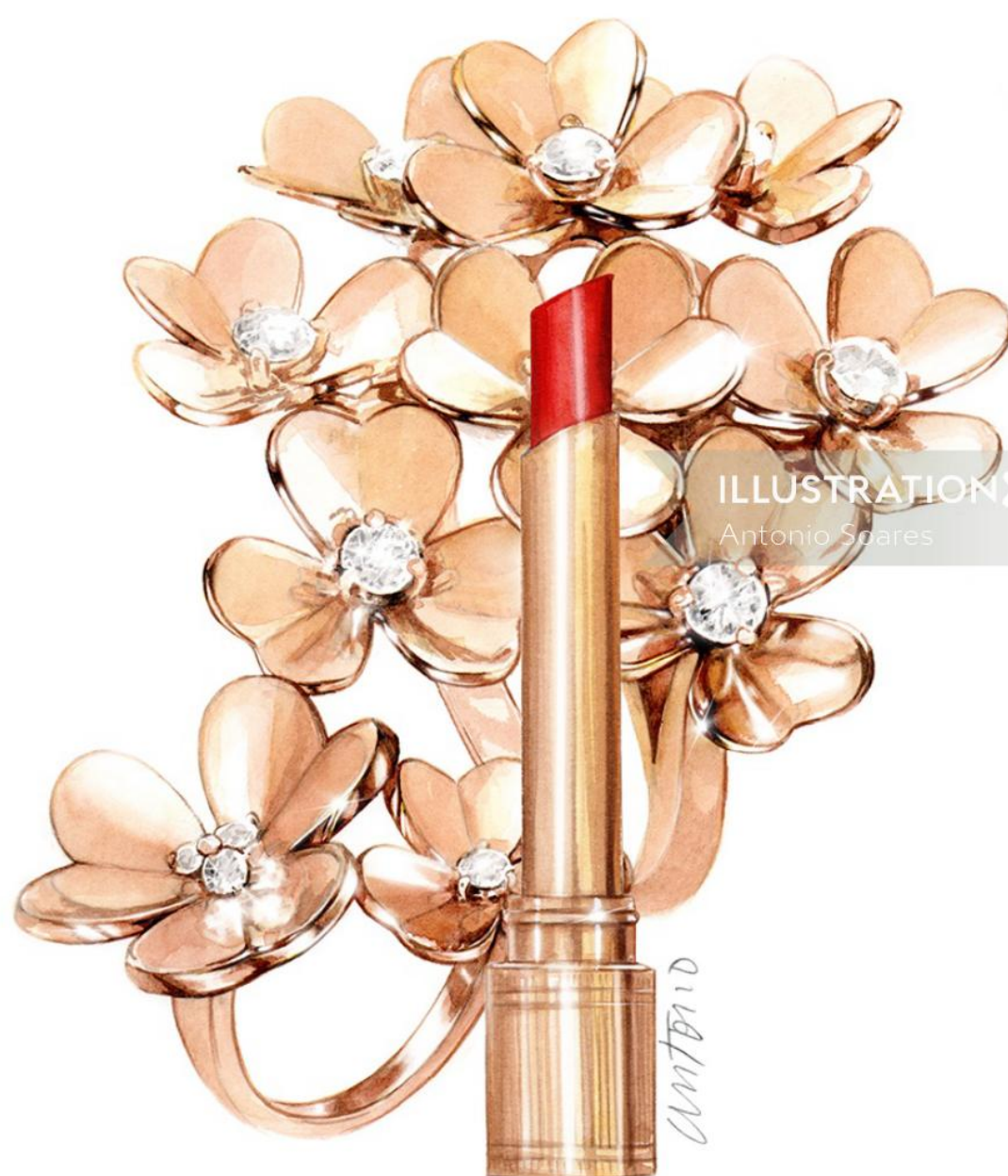
ILLUSTRATION X Antonio Soares