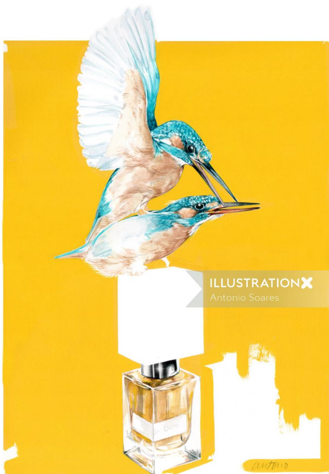
ILLUSTRATION X Antonio Soares