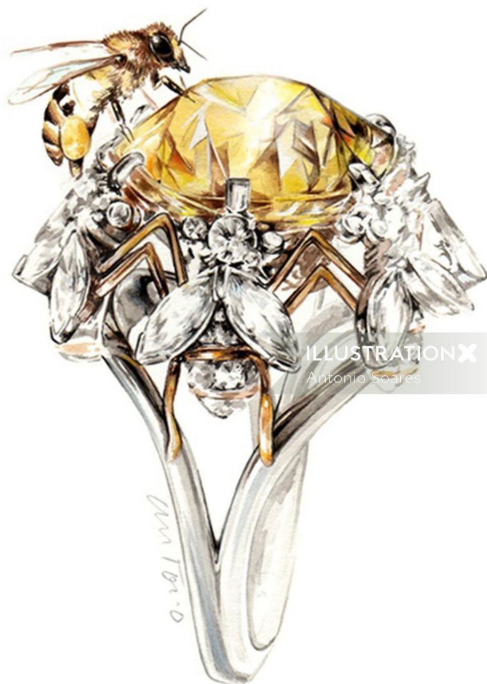
ILLUSTRATION X Antonio Soares