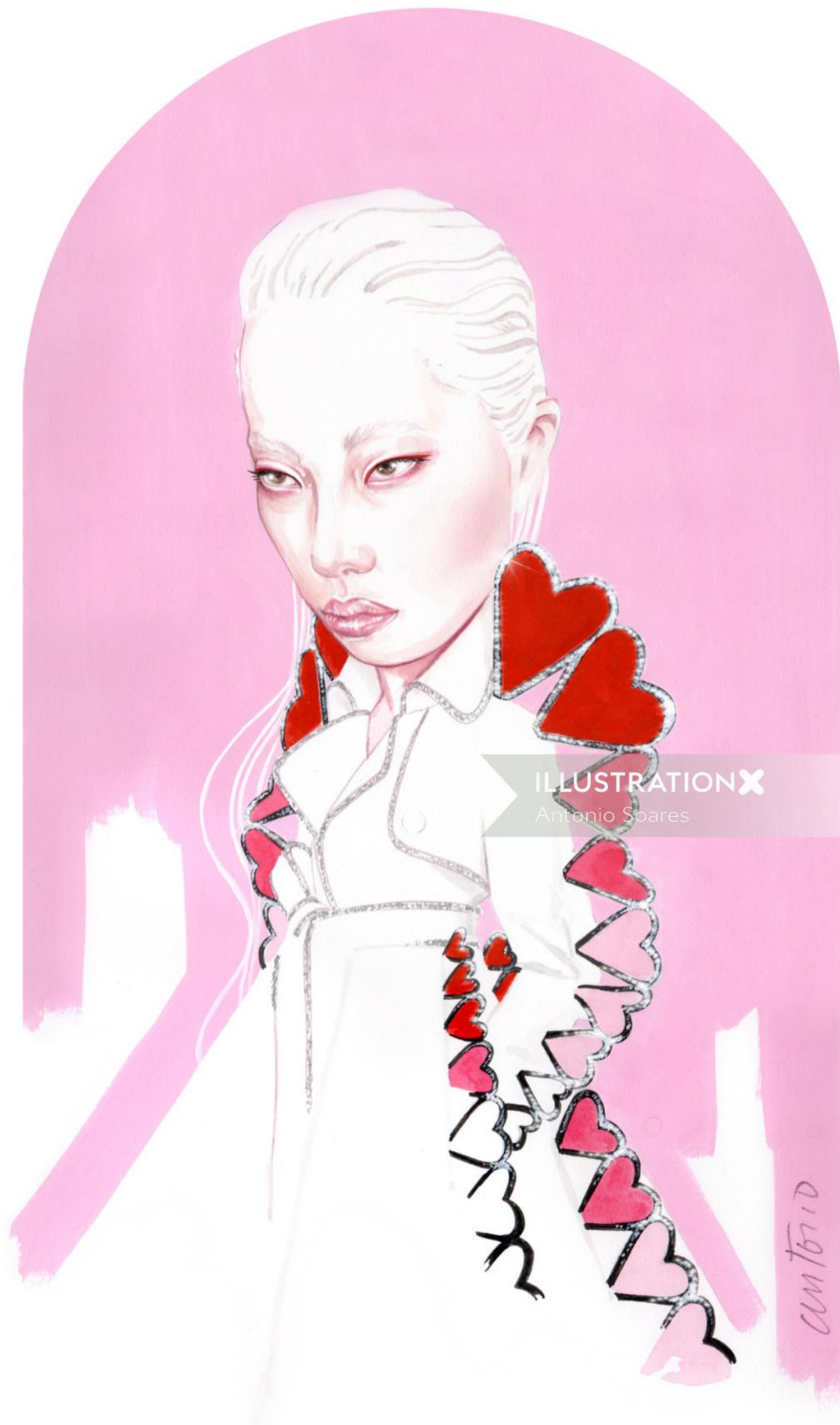
ILLUSTRATION X Antonio Soares