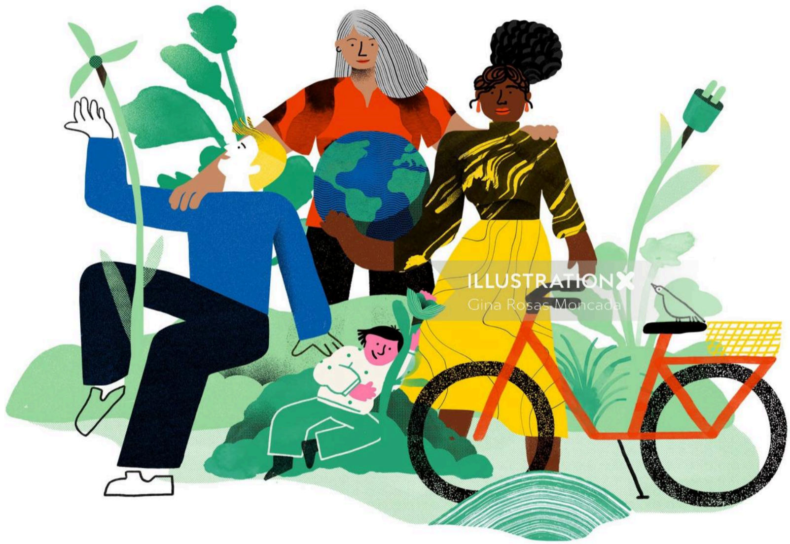
ILLUSTRATION X Gina Rosas Moncada

www.illustrationx.com/ko/GinaRosasMoncada