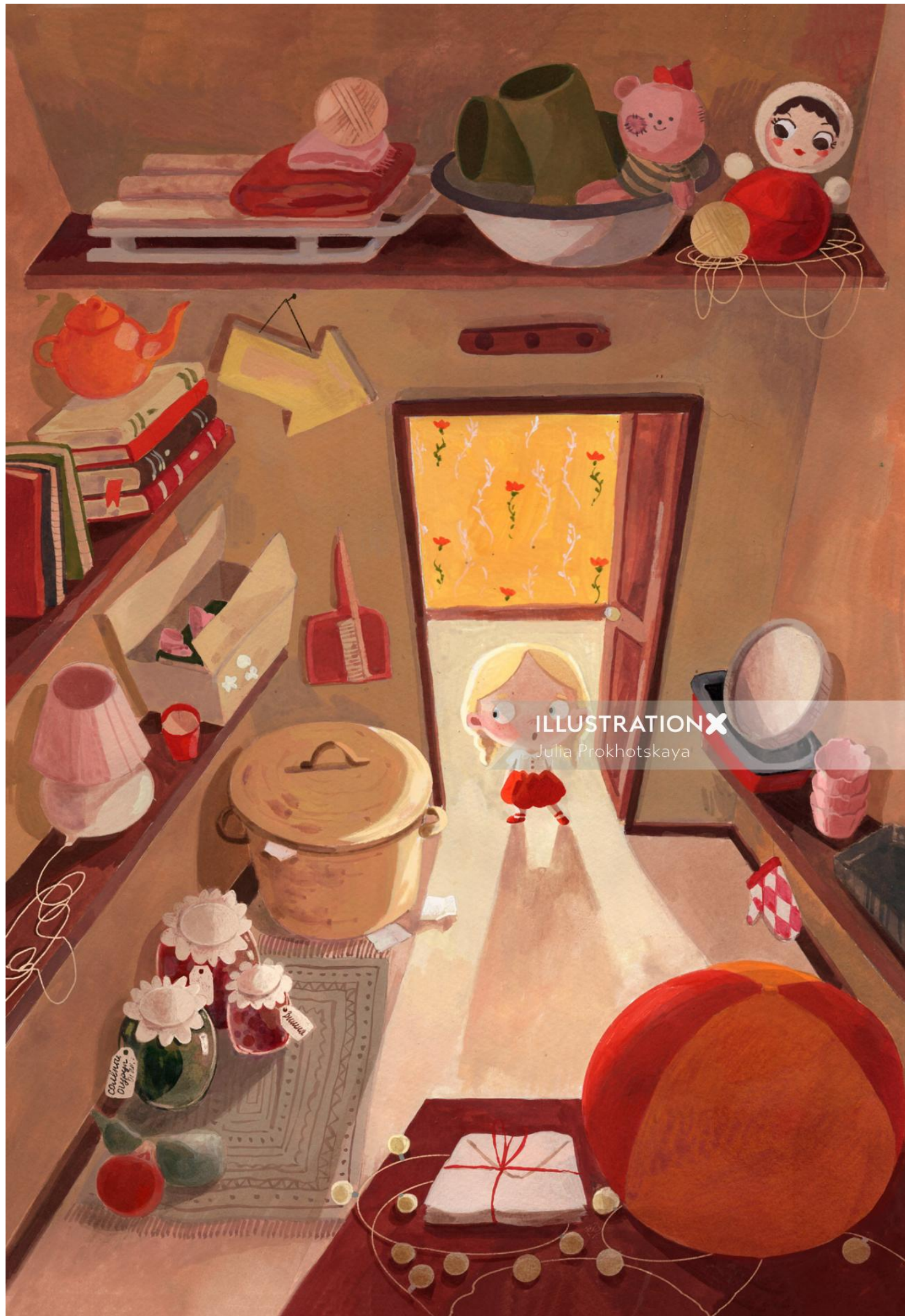
ILLUSTRATION X Julia Prokhotskaya

www.illustrationx.com/jp/JuliaProkhotskaya