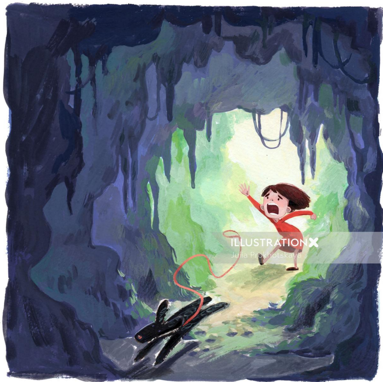
ILLUSTRATION X Julia Prokhotskaya

www.illustrationx.com/sx/JuliaProkhotskaya