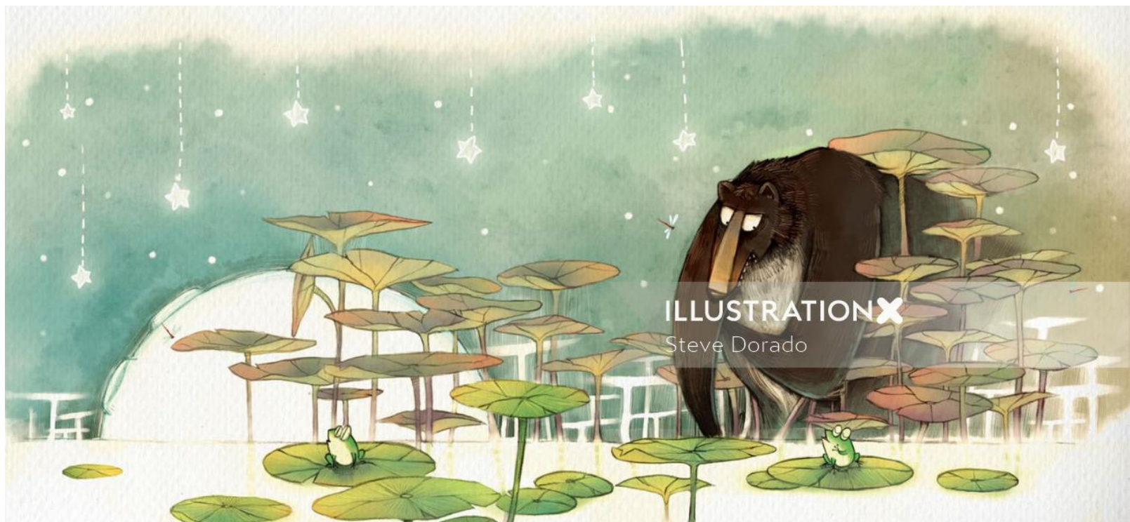
ILLUSTRATION X Steve Dorado