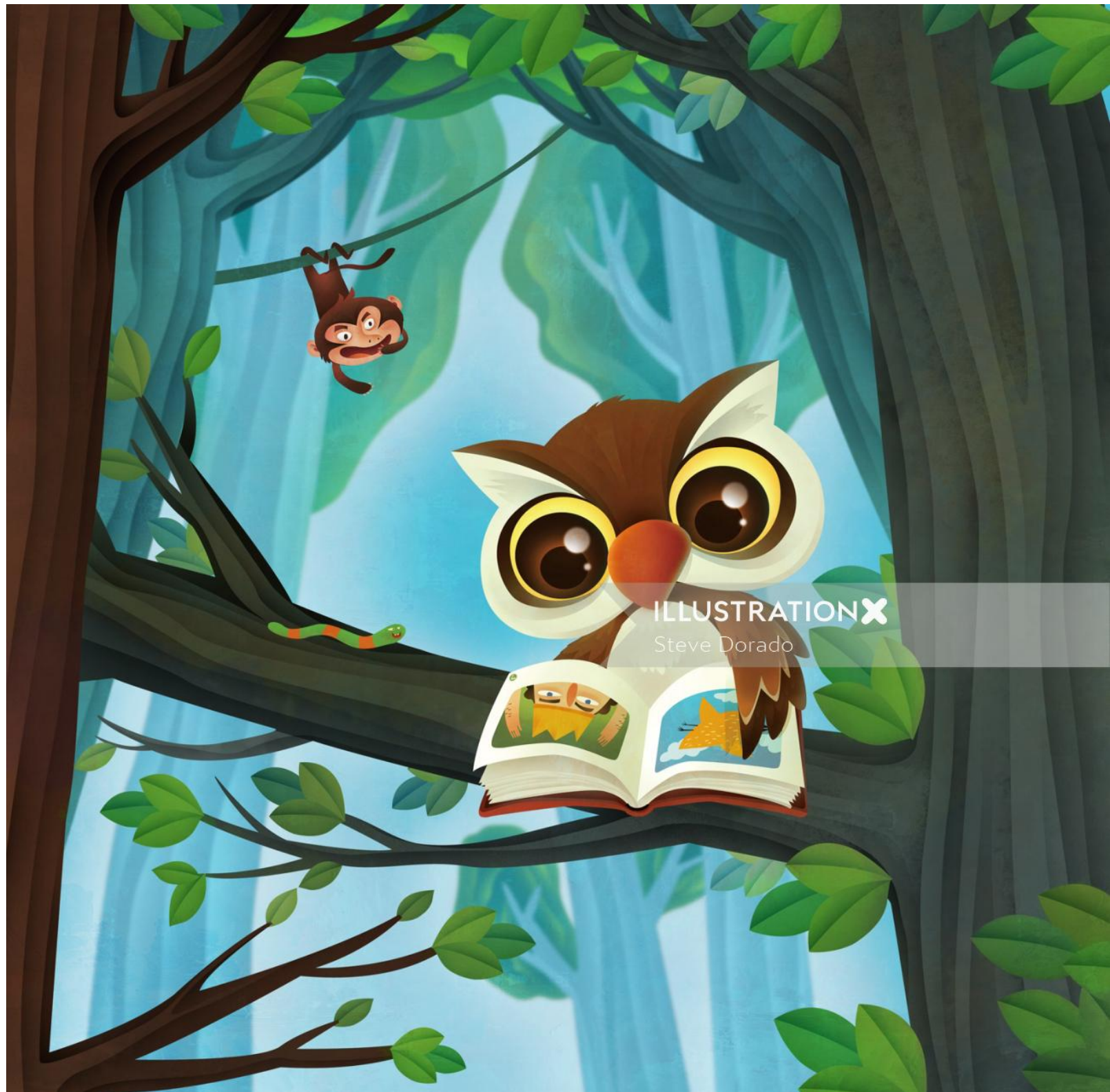
ILLUSTRATION X Steve Dorado