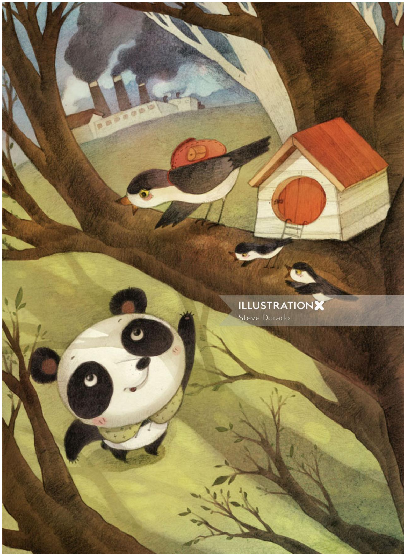
ILLUSTRATION X Steve Dorado